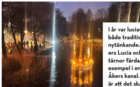
I år var luciafirandet både traditionellt och nytänkande. Österåkers Lucia och hennes tärnor färdades till exempel i en båt på Åkers kanal. Tanken är att det ska bli en ny tradition.